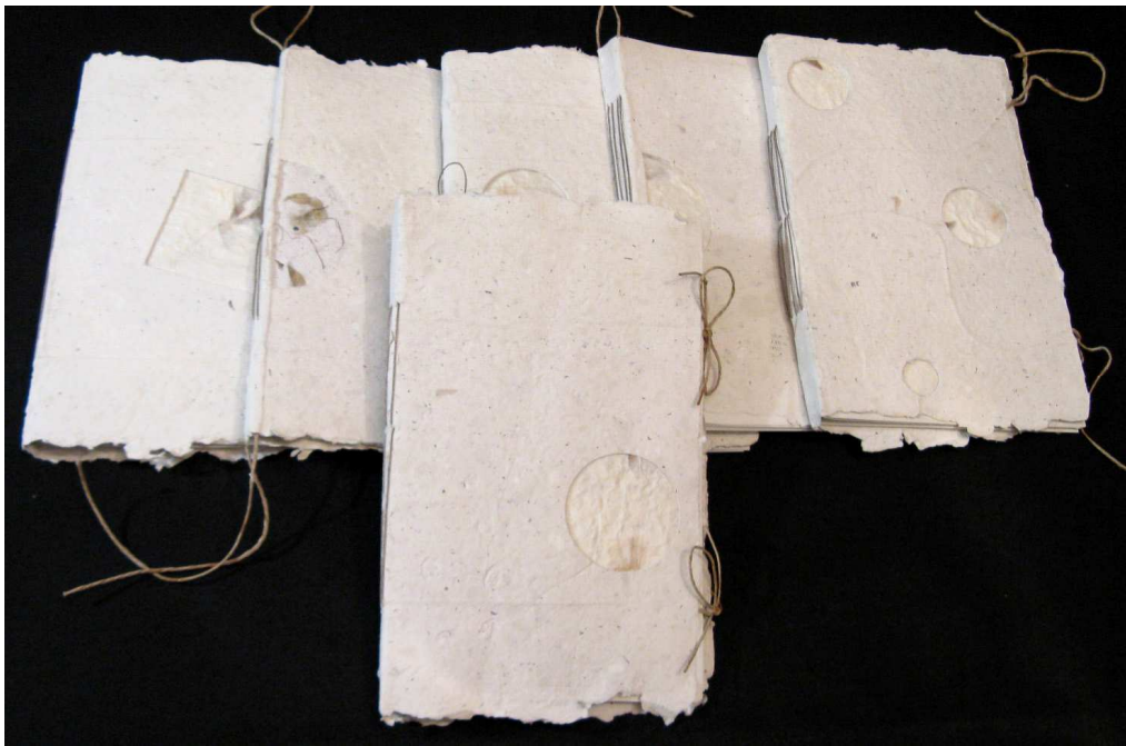
Costura vista con lomo.