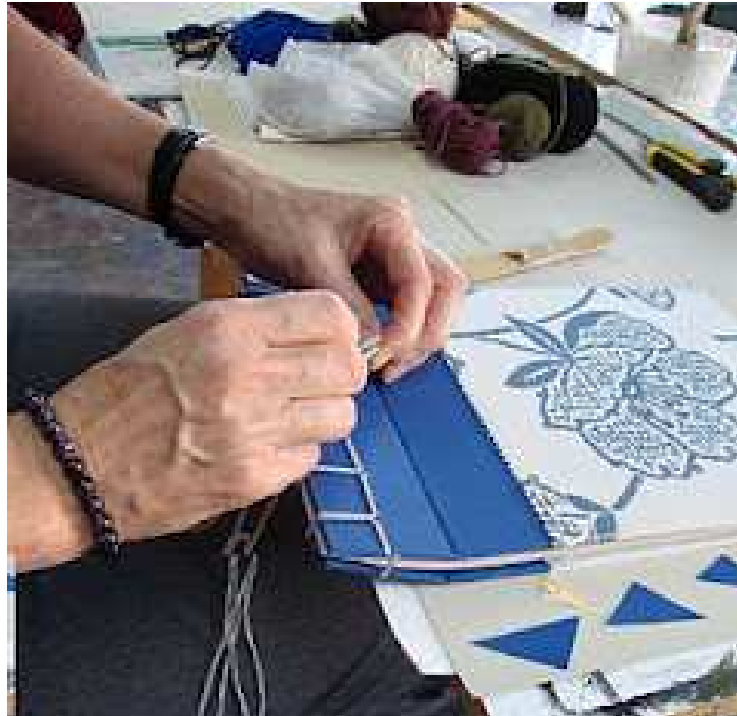
Costura del libro japonés.