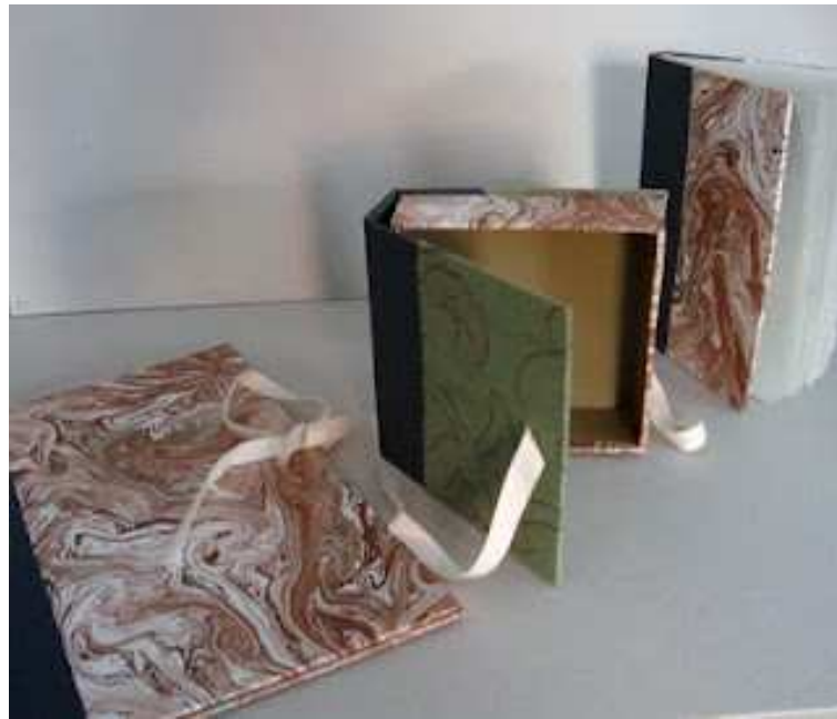
Carpeta, caja y libro.