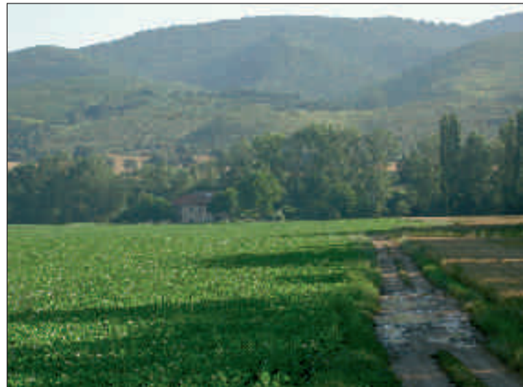
Vista de la Venta Blanca desde el camino de Villanañe a Espejo

La casona de la Venta Blanca, en los años treinta del siglo XX estaba en pie, pero en situación ruinosa. Servía de refugio para mendigos y trashumantes en su paso por estas tierras de Valdegovía. Parece ser una casa solariega o construida por persona adinerada, luego venida a menos. Pasado el puente que une la carretera con la finca, a mano izquierda, existía una pequeña capilla que estaba exenta. La existencia